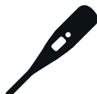
Verhoging of koorts