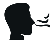
Reuk- en/of smaakverlies

Heb je op dit moment een huisgenoot met milde klachten en koorts en/of benauwdheid?