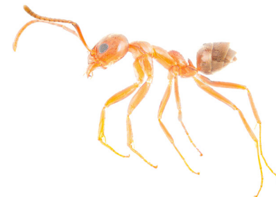
Argentijnse mier Linepithema humile