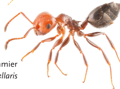
rode schorpioenmier Crematogaster scutellaris