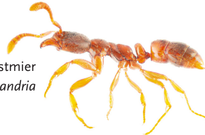
tropische compostmier Hypoponera ergatandria

Maak bij een (vermoedelijke) aanwezigheid van een exotische mierensoort melding bij EIS Kenniscentrum Insecten of Tuinbranche Nederland. Mieren determineren is specialistenwerk, dus bijna altijd is een opgestuurd monster of terreinbezoek nodig. Op basis van de determinatie en de mate van vestiging van de mieren, kunnen maatregelen voorgesteld worden. Bijvoorbeeld hoe de betreffende soort te verwijderen is of hoe voorkomen kan worden dat de mieren een plaag worden.