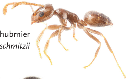
Atlantische dwergschubmier Plagiolepis schmitzii

Mieren leven in kolonies. Eén of meerdere koninginnen zitten diep verscholen in de grond en leggen eitjes. De werksters lopen ook buiten het nest rond op zoek naar eten en nieuwe nestelplekjes. Om van een exotische mierensoort af te komen is het nodig om de eileggende koninginnen te verwijderen. Vaak is dat een lastige, specialistische klus, waarbij iemand met ervaring ingeschakeld moet worden om de locatie en omvang van de kolonie te bepalen en op de juiste wijze te behandelen.