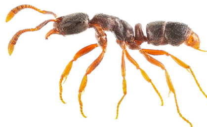
mediterrane compostmier Hypoponera eduardi