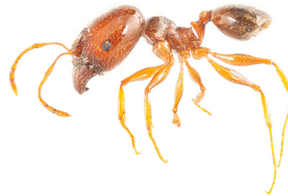
gewone dikkop Pheidole pallidula

Mieren zijn algemeen voorkomende insecten die meestal nesten maken in grond. Als er grond verplaatst wordt, bijvoorbeeld in plantenvotten, kunnen ze verslept worden. Zo zijn allerlei mieren die van nature niet voorkomen in Nederland ('exoten') toch hier terechtgekomen. Onderzoek laat zien dat bij groenverkopers diverse exotische soorten voorkomen, in plantenvotten maar ook gevestigd op het terrein. Via plantenverkoop worden ze verder verspreid naar woonwijken. Exotische soorten kunnen de inheemse flora en fauna aantasten. Hun verspreiding dient dus voorkomen te worden.