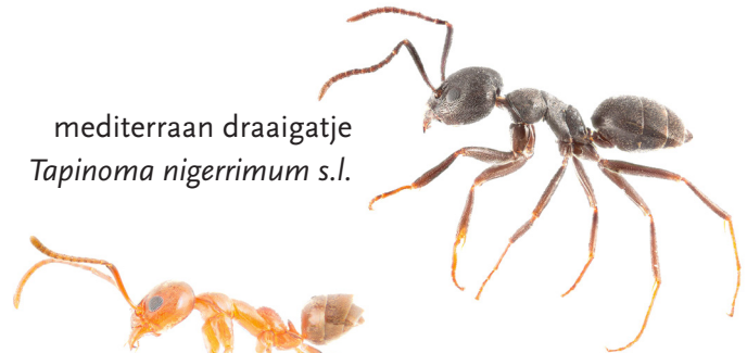
mediterraan draaigatje Tapinoma nigerrimum s.l.

Enkele exotische mieren kunnen uitgroeien tot ernstige plaagdieren in woonwijken. Het gaat om soorten die in superkolonies leven. Hierbij wordt de dichtheid van mieren zo groot, dat op allerlei vlakken overlast en schade ontstaat en er vaak erg veel kosten gemaakt moeten worden om een wijk leefbaar te houden. Hieronder staan de drie meest overlast gevende soorten. Import en verspreiding van deze mieren moet altijd voorkomen worden en bij signalering is het nodig om direct in actie te komen en te beoordelen of en hoe bestrijding gestart moet worden.