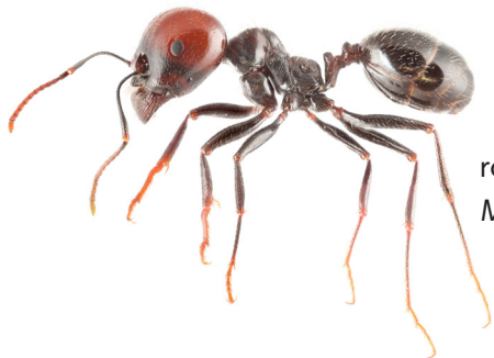
roodkopgraanmier Messor barbarus