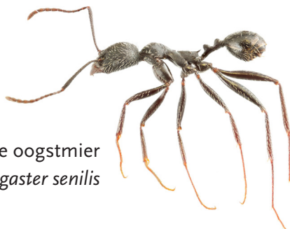
slanke oogstmier Aphaenogaster senilis