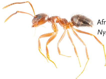
Afrikaanse langsprietmier Nylanderia jaegerskioeldi