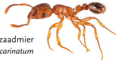
ribbelzaadmier Tetramorium bicarinatum